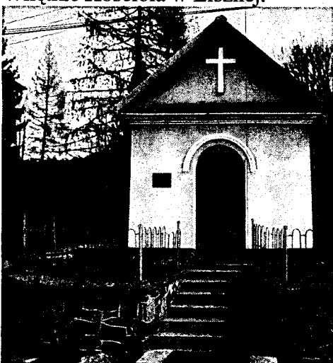
Kapliczka w Lisznej.

2021.01.14 10:00:00 2021.01.14 10:00:00 2021.01.14 10:00:00