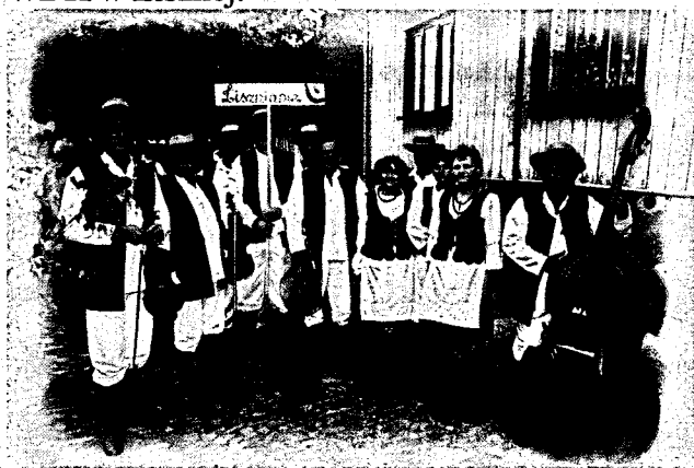
Zespół w Lisznej.