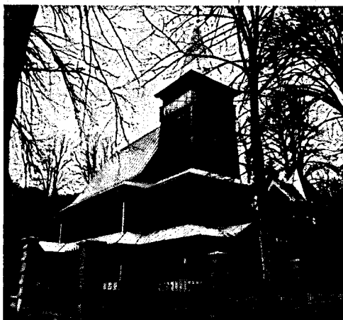
Kościół w Lisznej.