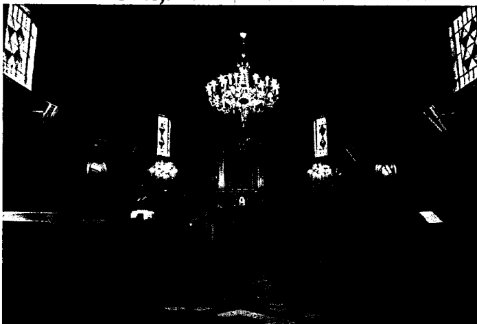
Wnętrze Kościoła w Lisznej.