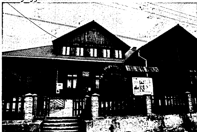
WDK w Lisznej.