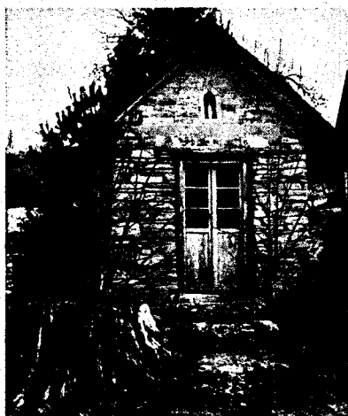
Kapliczka w Lisznej.